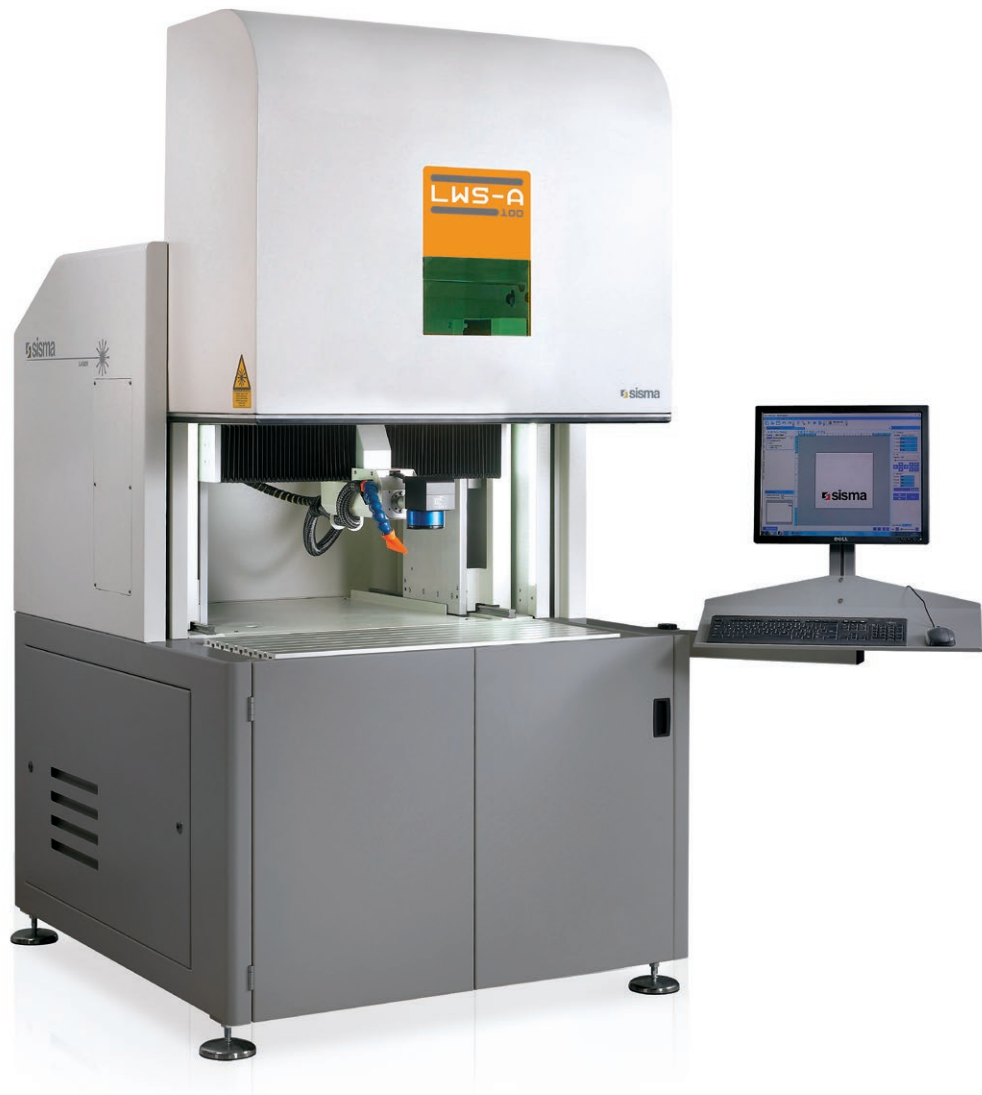
Laser marking stations with three axes Stazioni di marcatura laser a tre assi